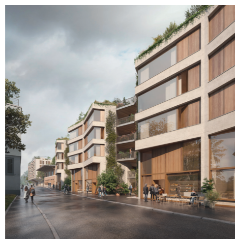
Hosoya Schaefer Architects AG Zürich (Renderings 2020)