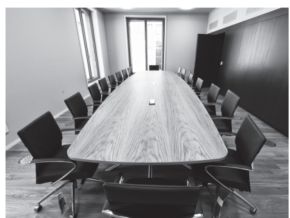
Am Freitag und Samstag kann man das neue Gemeindehaus (hier der Gemeinderatssaal) und das renovierte Bauamt besichtigen.

Das Streichmusikensemble «The Strings» rund um die Cellospielerin Sarah Cohen ist klassisch ausgebildet, zu hören sind Violine, Bratsche und Cello. Der Bläsersatz der Partyband «Spooky