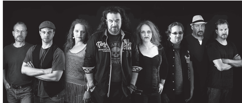
Die Mundartrockers von «Filterlos» treten mit vielen anderen Musikern gemeinsam auf der grossen Bühne auf – heute Freitag ab 21.15 Uhr.