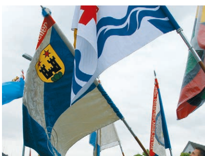
Auf dem neuen Dorfplatz kommen die Fahnen zum Empfang der Schützen besonders gut zur Geltung (Samstag 10.00 bis 10.30 Uhr).

Für die Kleinen ist heute gleich nochmals Chilbi: Thomas Aebi hat sein nostalgisches Kinderkarussell, ein Gumpizelt und eine Schifflischaukel aufgestellt, man kann sich zum Schmetterling, Tiger oder Büsi schminken lassen und am Glücksrad drehen. Die Feuerwehr Meilen sorgt für einen Spielparcours. Und zum Essen backt der Verein Fee später feine Waffeln.