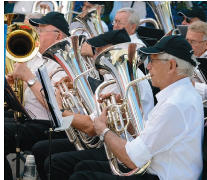
Sorgt für musikalische Unterhaltung am Freitagnachmittag ab 13 Uhr: Die Veteranenblasmusik.