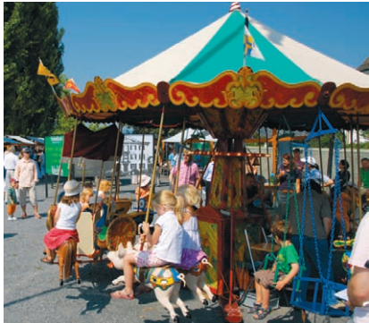
Für die Kleinen gibt's heute Freitag ein Karussell. Es dreht sich von 10.30 bis 20 Uhr.